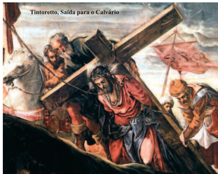
Tintoretto, Saída para o Calvário

Exultem e em Ti se rejubilem aqueles que te buscam; digam sempre: "O Senhor é grande!" aqueles que amam a tua salvação.