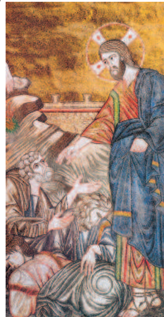
Jesus sobe no monte das oliveiras, século XIII Veneza, São Marco

Apareça a tua obra aos teus servos, e a tua glória sobre seus filhos. E seja sobre nós a formosura do Senhor, nosso Deus: confirma sobre nós a obra das nossas mãos; confirma a obra das nossas mãos.