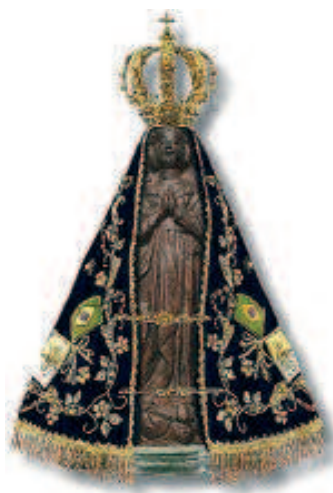
Nossa Senhora Aparecida

(Espaço pelas intenções livres e orações)