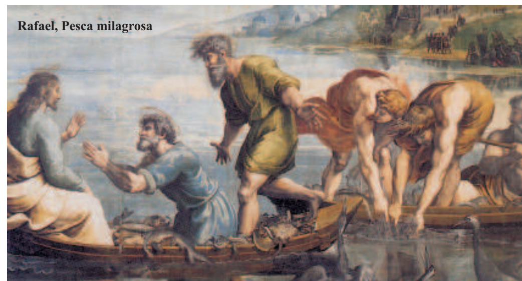
Rafael, Pesca milagrosa

Os ímpios me espreitam para destruir-me; estou atento aos teus ensinamentos. Em toda coisa perfeita vi o limite: mas o teu mandamento é infinito.